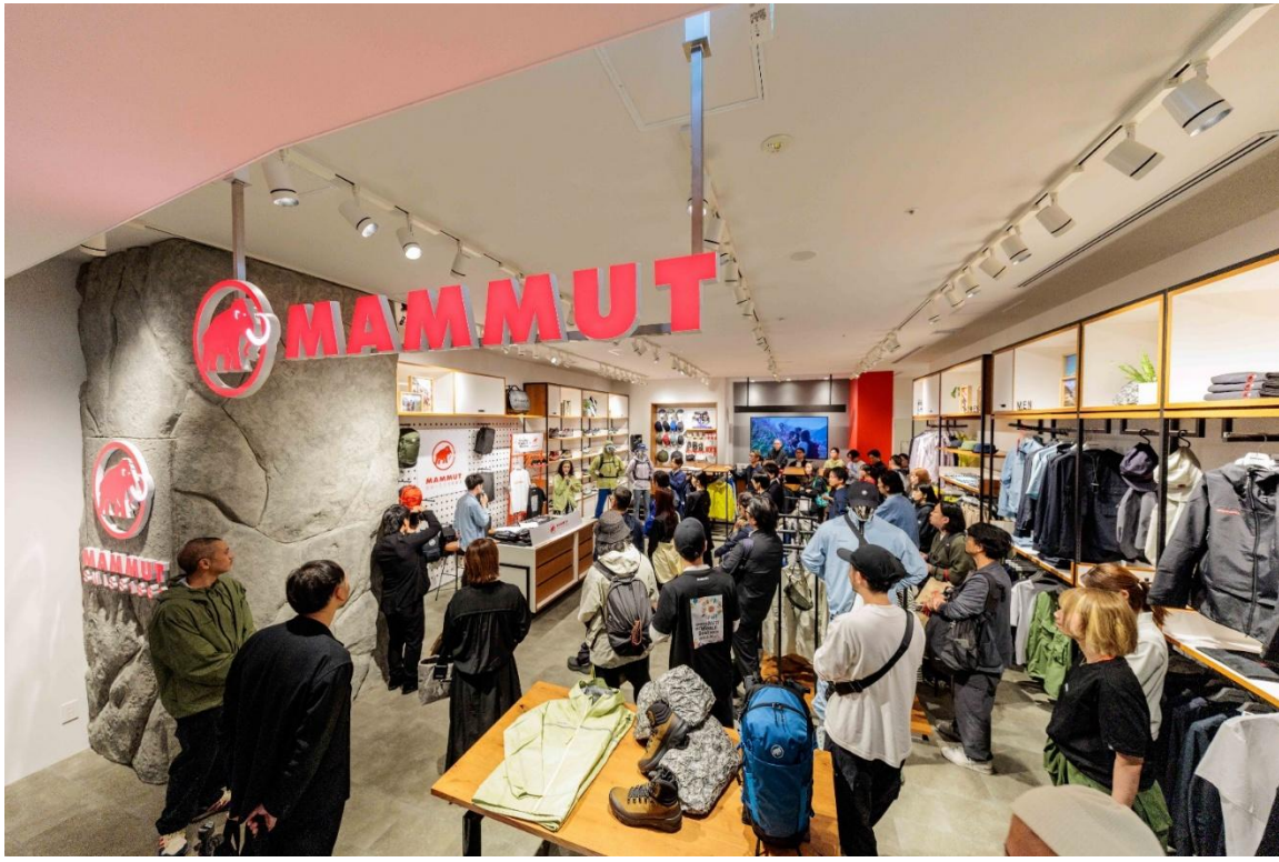
【「マムート 心齋橋」店舗写真】