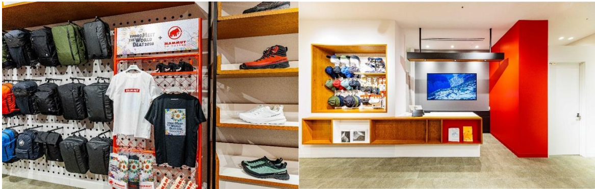
左写真：オープン記念などの限定プロダクト、 右写真：レジカウンター