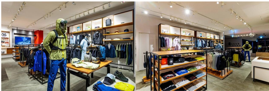
左写真：ストア正面からアパレル全体、右写真：ストア内からアパレル全体