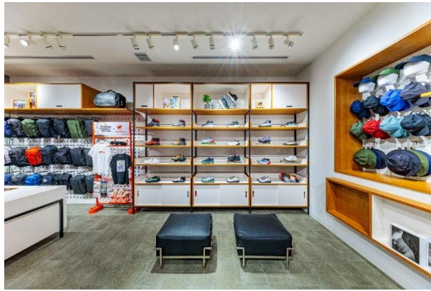
バックパック、シューズ、キャップ・ハット売場