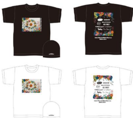
Col: BLACK・WHITE Size: M・L・XL (3サイズ展開)