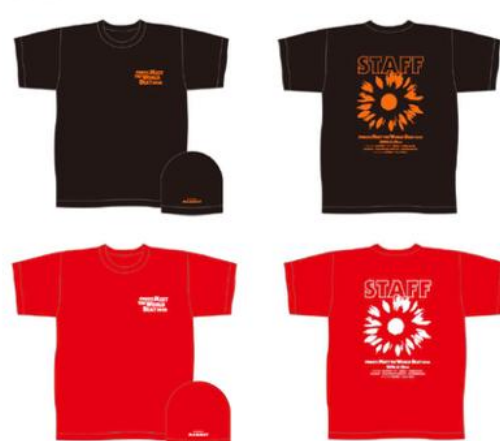
Col: BLACK・RED Size: M・L・XL (3サイズ展開)