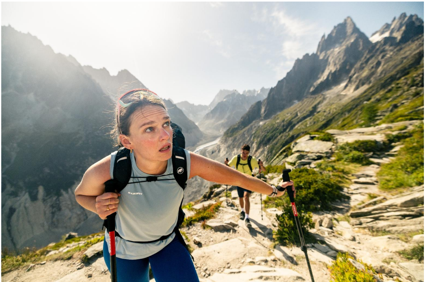
スイス政府観光局 協賛 DO IT ANYWAY.キャンペーン 3月10日(火)~6月24日(水)

1862年にスイスでロープメーカーとして誕生し、160年以上の歴史を積み重ねてきたマムート。アウトドアアパレルとギアの革新的な商品を生み出し続けることで、皆様に「究極の体験」を提供してきました。ブランドスローガン「Rise with the Mountain – 挑戦こそが人生だ。」を掲げ、挑戦を通して成長していく人々を、高性能なプロダクトの提供や新しいコンセプトの提案でサポートしてまいります。