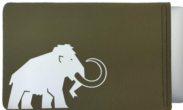
持ち運びやバックの中に入れる際に PC を保護してくれるオリジナル PC ケース