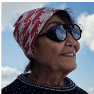
今井通子氏 2025 年 アイガー氷河にて

当時ヨーロッパでは、女性が働くのに夫の許可を得る必要があった時代に、この偉業を成し遂げたのである。彼女の勇気と決意は、幾世代にもわたる登山家や女性たち、そして今このコレクションにとってのインスピレーションの灯火となっている。