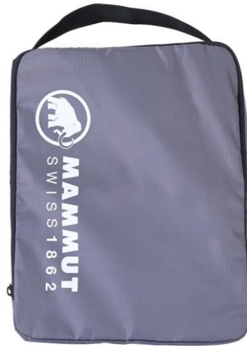
トレッキングシューズまで対応しているオリジナルシューズケース