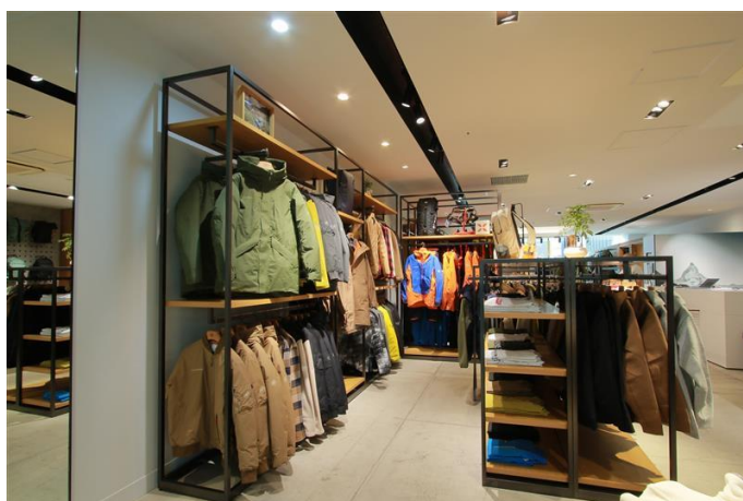
ブランド体験スペース“ヒュッテ 1862”を中心に、幅広い製品が並ぶ店内