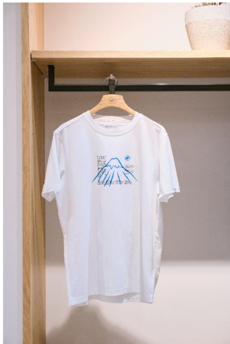
富士山のデザインをあしらった「QD Fujiyama Print T-Shirt AF (QD フジヤマ プリント T シャツ AF)」

このストアには、スイスの自然とデザインに磨かれたマムートラインナップの販売に加え、特別なプロダクトの販売や先行販売を計画しております。第一弾は、「QD Fujiyama Print T-Shirt AF」の先行販売を行います。スイスのチーフデザイナーがデザインしたこのTシャツは、英字で富士山について記載があります。スイスデザインでの富士山の表現になっております。日本一高いことはもちろん、世界で最も登られている山のひとつとして紹介。さらに4つの登山ルートについても紹介しております。