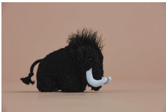
大人気のマムート・トイがもらえるチャンス！この機会をお見逃しなく！