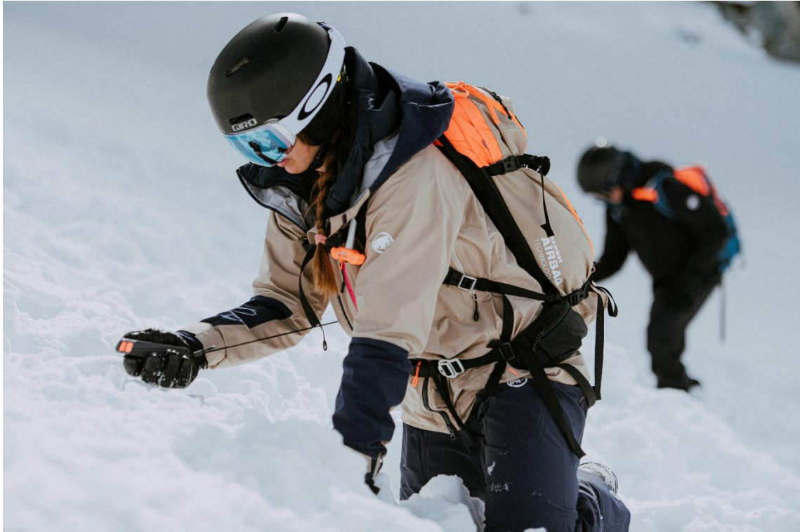
グローブを使用した状態でも使いやすいように設計されたアバランチビーコン「バリーボックス」

マムートのアバランチビーコン「バリーボックス -Barryvox-」は、世界的にも高い評価を得ております。業界トップの最大 70mの捜索範囲、グローブを使用している状態でも操作がしやすいように考え抜かれた設計です。初めての方が使ってもわかりやすいユーザーインターフェースなど数々の点において多くのユーザーを魅了し、冬山の安全をサポートしてきました。特に近年においては年々加速する温暖化の影響により、以前では雪崩が起きなかった場所でも雪崩が起こるようになるなど、安全管理がより難しくなっています。そういった状況下においても「バリーボックス」を使うことで少しでも皆様の安全のサポートになればと思っております。