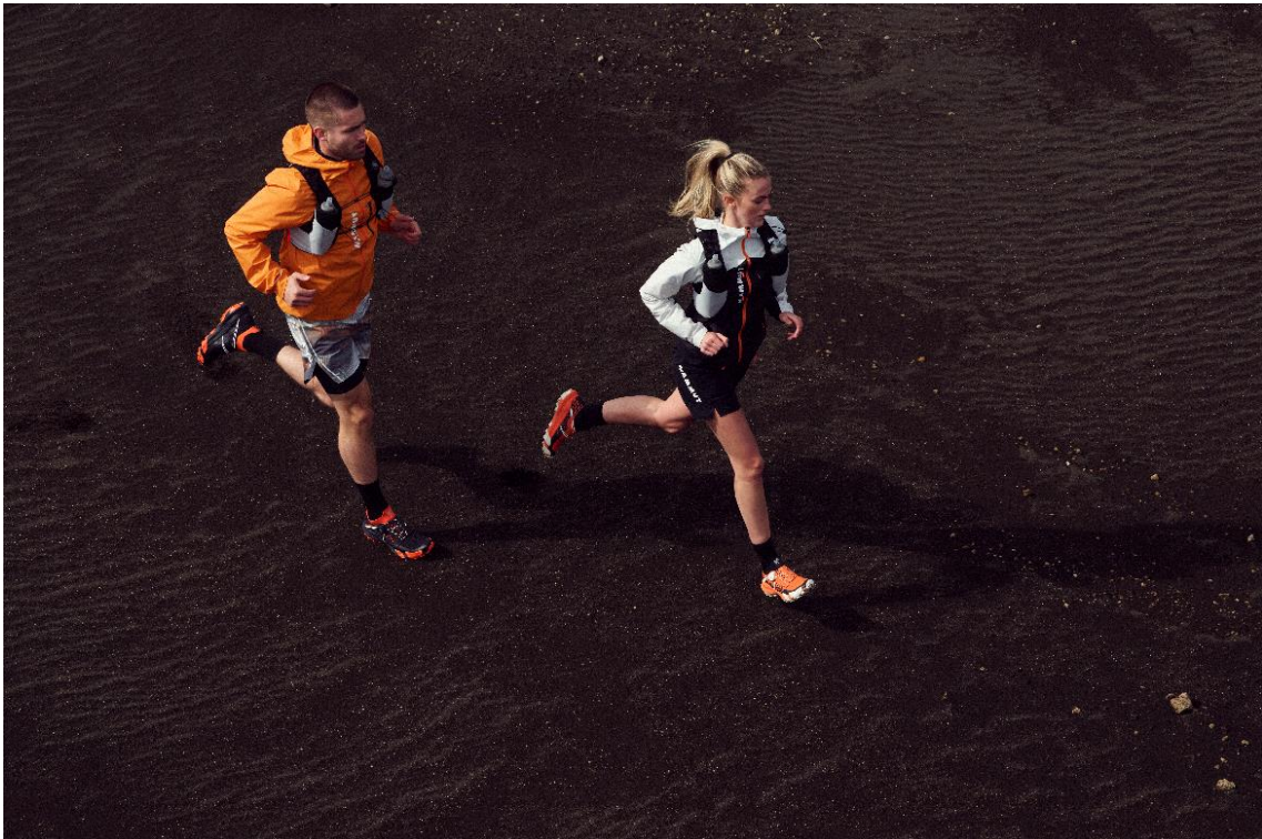
「軽さ」と「動きやすさ」に特化したトレイルランニング・シリーズ

23年春夏のコレクションからは、トレイルランニング・シリーズが新たにコレクションに追加され、アパレル、バックパック、シューズのフルラインナップが揃っております。すべての製品においてマムートコレクションの中でも「軽さ」と「動きやすさ」にフォーカスしており、最軽量のアウトターやインナーなどが揃っております。また、トレイルランニング・シリーズは、100%脱炭素を実現したプロダクトになっており、大気中から二酸化炭素を除去するパイオニアであり、リーダーである Climeworks（クライムワークス）社と提携し、トレイルランニング製品の生産に伴い排出された Co2 を回収、地下に貯蔵することで環境へ影響が及ばないプロダクトとなっております。Climeworks 社詳細に関して： https://www.mammut.jp/news/8247