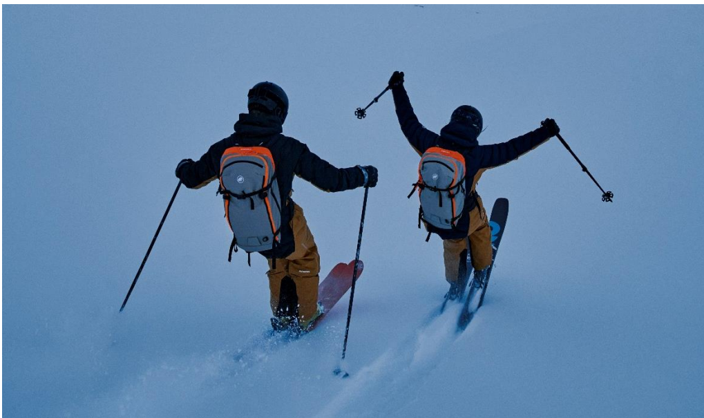
2月：ノートラックのコンディションでのスキー