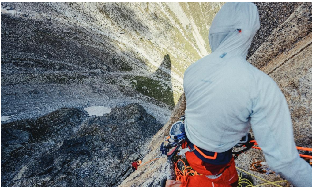
8月：断崖絶壁で行われるロープクライミング

毎年大好評の卓上カレンダー。裏面には素敵な景色と共に登山やスキーなどの景色を見る事ができる。