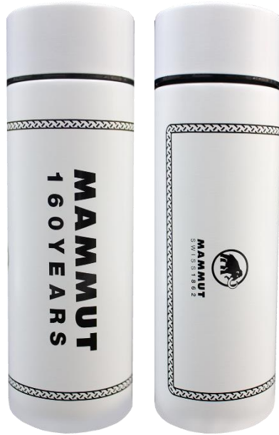
160周年を記念したデザインのオリジナルボトル