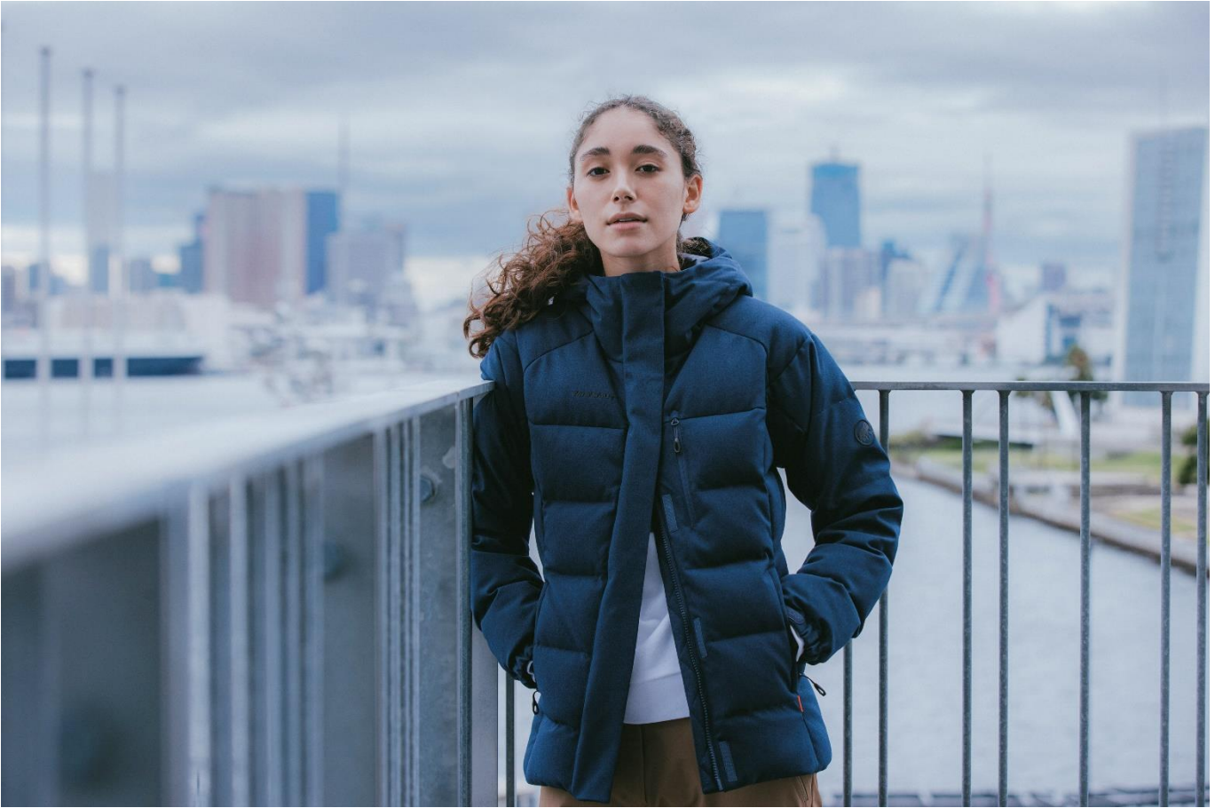
Roseg IN Hooded Jacket AF Women / ¥52,800-