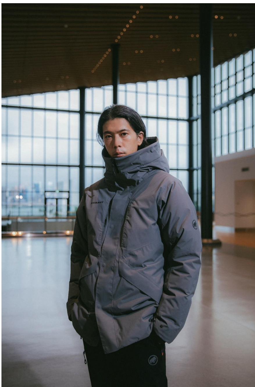
Floeberg HS Thermo Hooded Coat AF Men / ¥74,800-