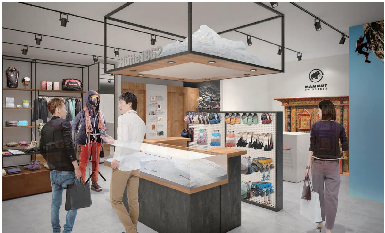
店内の中心に設置されたブランド体験スペース“ヒュッテ 1862”

ファッションの感度の高い大阪での展開ということもあり、アーバンウェアの展開に注力します。マムートが培ってきたマウンテンテクノロジーをアーバンというフィールドで活用することで、どのような快適性・機能性を発揮するのかを、素材のみならずデザインやコーディネートを含めて様々な形でご提案いたします。アウトドアのみならず、アーバンシーンでも、ユーザーのパフォーマンスを最大化するプロダクトを展開します。