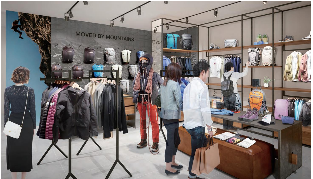
旗艦店らしい充実のラインナップ。アーバンウェアから本格的なギアまで展開