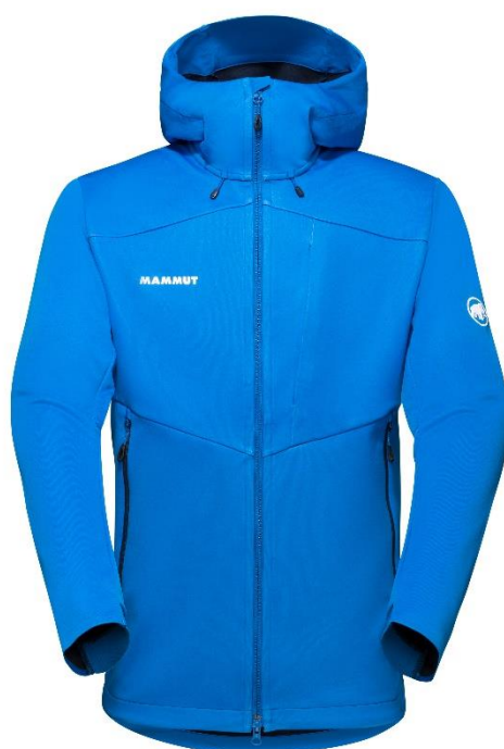
表地と裏地にリサイクル素材を使用したソフトシェルジャケット。bluesign 認証・PFC フリー撥水加工も 1011-01780 Ultimate VII SO Hooded Jacket AF Men / ¥35,200-