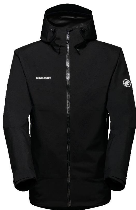
PFC フリーの撥水加工を施した Gore-Tex ジャケット。軽量で通年使える人気商品 1010-28451 Convey Tour HS Hooded Jacket AF Men / ¥33,000-