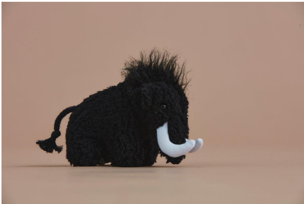
毎回大好評のノベルティ「マムート・トイ」