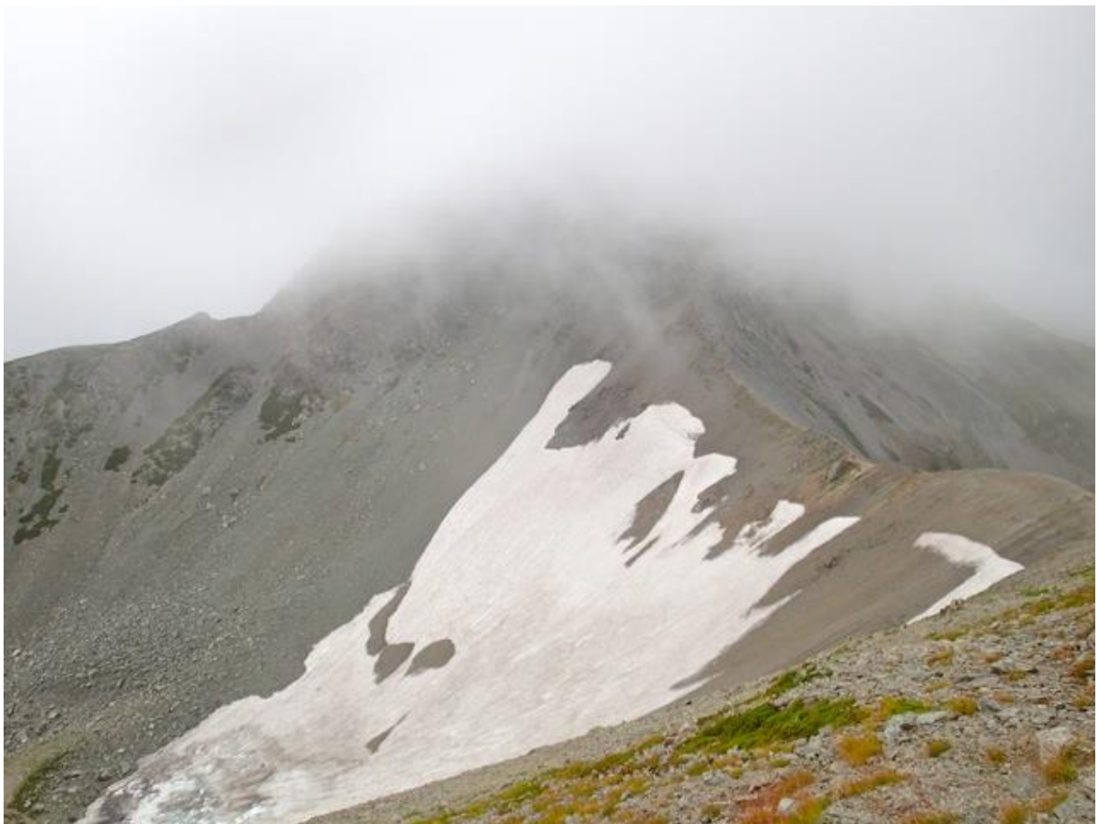
氷河によって形作られた内蔵助カールに現存する氷河。