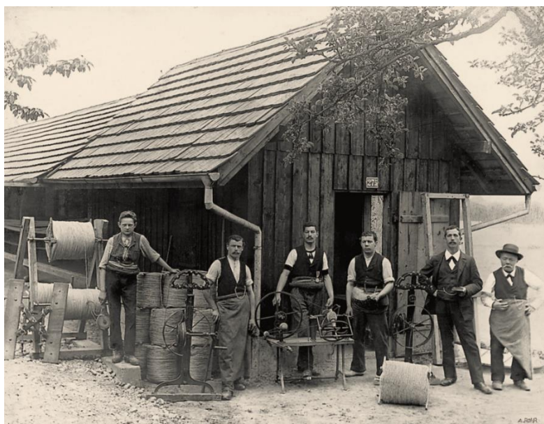
スイス・ディンティコンでロープメーカーとして創業。マムートはドイツ語でマンモスという意味

マムートは、1862年スイス・ディンティコンでロープメーカーとして誕生しました。農業用のロープとしてスタートし、時代の流れと共に登山用ロープとして使われるようになりました。1964年には国際登山組織 UIAA の認定を初めて受けたシングルロープを開発し、ロープブランドとしてのポジションを確立。その後、1984年にはアパレル・カラビナ・ハーネスを含む総合的なコレクションを発表し、ハードウェアブランドから総合マウンテンブランドへと発展していきます。その後、1995年に発表された「エクストリームコレクション」は、トップアスリートと共同開発されたマムートの最高峰モデルです。最先端の素材と高い技術力で機能性・品質を妥協なく追い求め、革新的な製品を多く作り出し、名誉ある賞を受賞するまでになりました。2022年現在でも、このエクストリームコレクションは、「アイガー・エクストリーム」(Eiger Extreme)と名前を変え、マムートのフラッグシップコレクションとしてトップアスリートと共に作り続けることで、多くのお客様に革新的な製品を提案し続けています。マムートは160年の間に培ったイノベーションの遺伝子をもとに、今後も多くのイノベーションを生み出していきます。