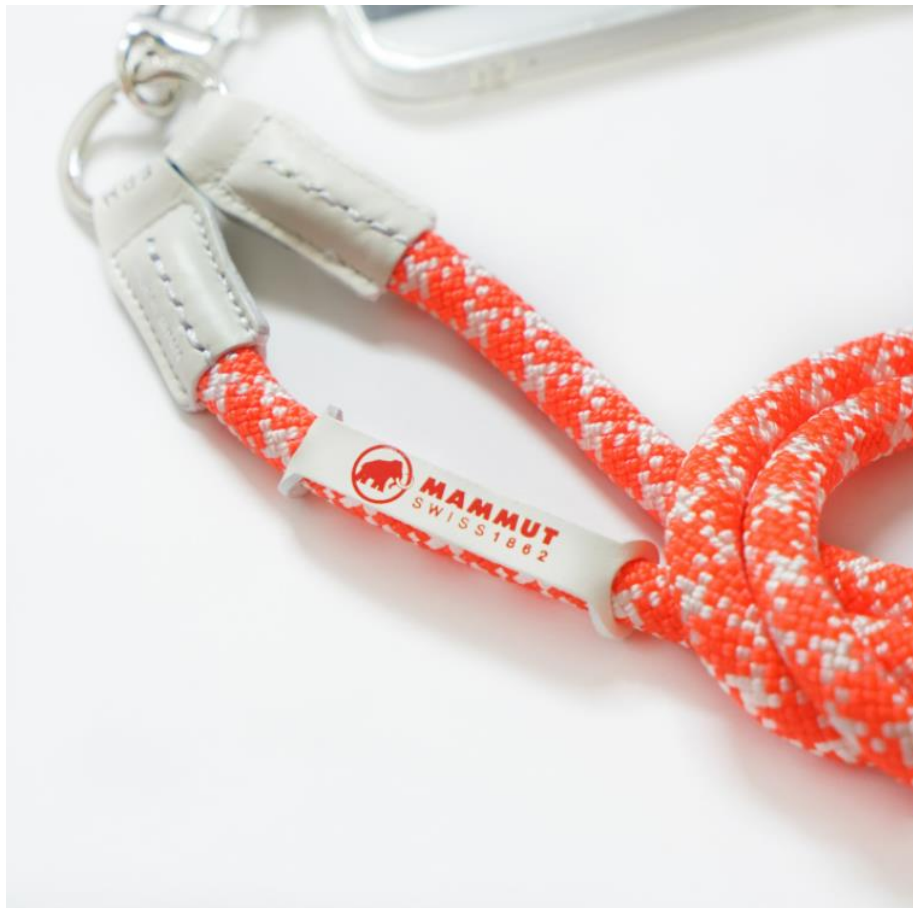
YOSEMITE STRAP として初のホワイトレザーのパーツ。マムートのロゴカラーとの相性も抜群。