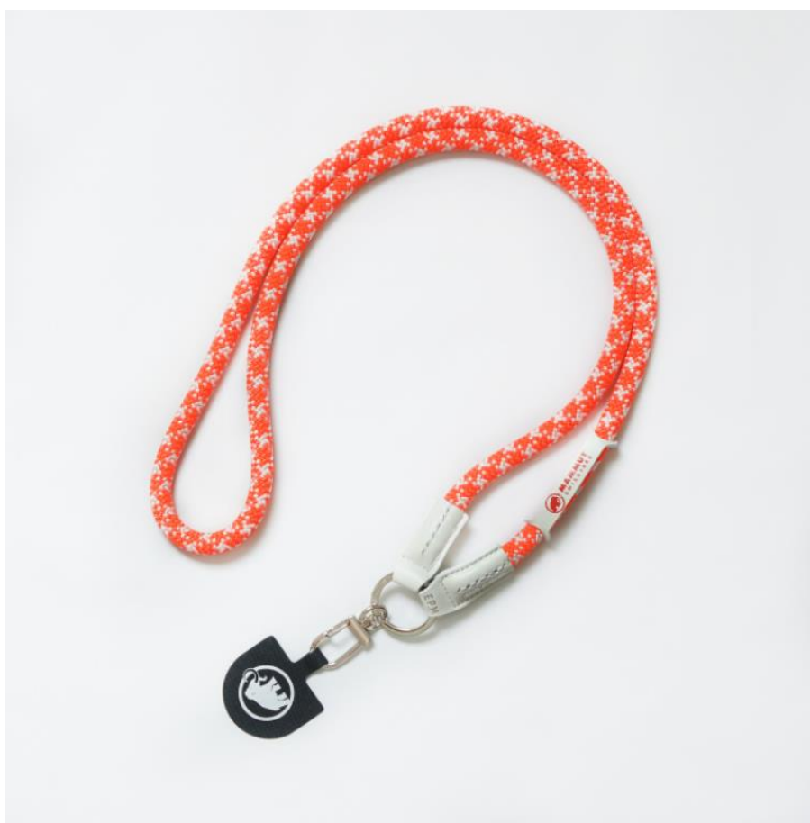
携帯カバーが付いていればほとんどの機種に対応できるアタッチメントにはマンモスロゴが施されている。