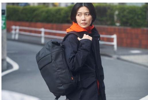
haru. / age : 26

台湾人の父と日本人の母を持つ、東京生まれのアーティスト/イラストレーター。アパレル、広告、雑誌を中心に国内外問わずグローバルなアーティストとして活動の幅を広げている。これまでに HUMAN MADE®、adidas、Better、SNEEZE、Richardson、ISETAN、BEAMS、などへ作品を提供。友人らと登山を楽しむ。