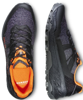
ゴアテックスを使用したシューズは雨の日でも安心の一足 Sertig II Low GTX (サーティグ ツー ロー ゴアテックス) / ¥16,500-

また、同様にシューズに関しても登山靴で培ったテクノロジーを贅沢に適用した仕様のモデルが多く、日常の長時間のシーンにおいても疲れず、快適さを提供してくれるプロダクトが展開されます。特に、「Sertig II Low GTX (サーティグ ツー ロー ゴアテックス)」は、ゴアテックスを使用しているモデルの中でも蒸れにくいモデルになっており、快適に過ごせます。ミッドソールも厚めにすることで履き心地もよく、濡れない・濡れない・疲れないの三拍子がそろったおすすめの一足です。