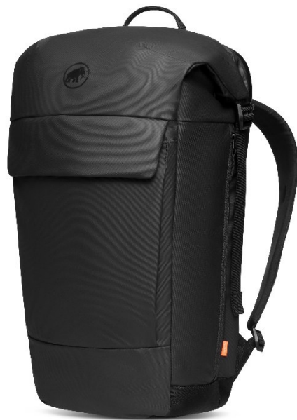
ロールトップクロージャー仕様の「Seon Courier 20 (セオン クーリエ 20)」 / ¥16,500

また、同様にシューズに関しても登山靴で培ったテクノロジーを贅沢に適用した仕様のモデルが多く、日常の長時間のシーンにおいても疲れず、快適さを提供してくれるプロダクトが展開されます。特に、「Sertig II Low GTX (サーティグ ツー ロー ゴアテックス)」は、ゴアテックスを使用しているモデルの中でも蒸れにくいモデルになっており、快適に過ごせます。ミッドソールも厚めにすることで履き心地もよく、濡れない・濡れない・疲れないの三拍子がそろったおすすめの一足です。