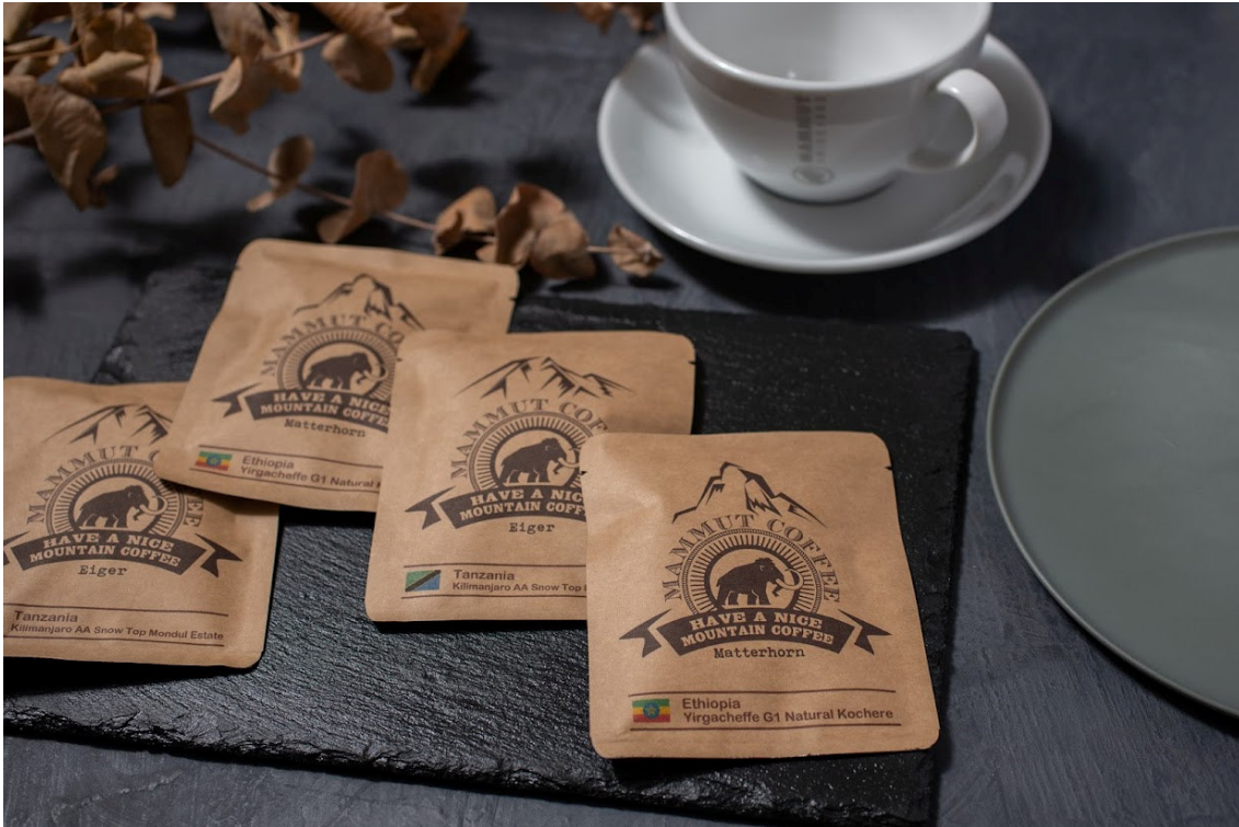
スイスの山がデザインされたオリジナルパッケージのドリップコーヒー

3月25日(金)より全国のマムートストア、公式オンラインストア、及び、一部正規販売店にて「From Work To Climb (フロム ワーク トゥ クライム)」キャンペーンを開催いたします。対象商品を10,000円以上(税込)お買い上げのお客様に、アウトドアで楽しむのに最適な「マムート・オリジナルドリップコーヒー」をプレゼントいたします。詳しい情報は、公式オンラインストア・ニュースをご確認ください。