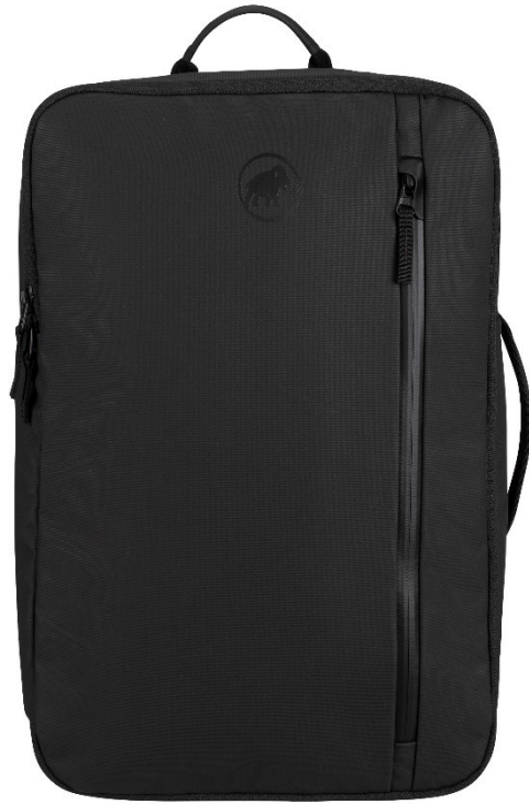
「From Work To Climb」の代表モデル Seon Transporter 25 (セオン トランスポーター 25) / ¥19,800-