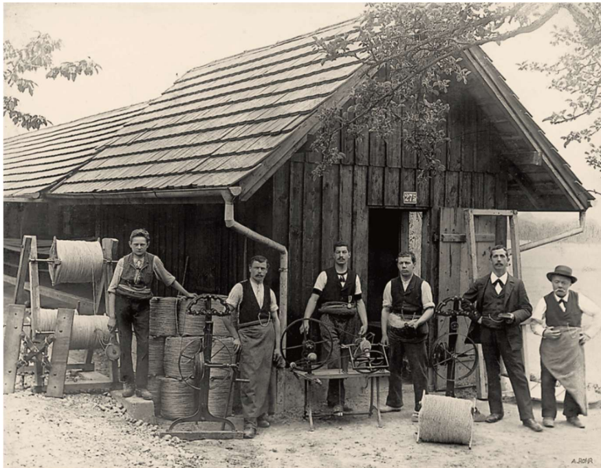
スイス・ディンティコンでロープメーカーとして創業。マムートはドイツ語でマンモスという意味

トップアスリートと共同開発されたマムートの最高峰モデルです。最先端の素材と高い技術力で機能性・品質を妥協なく追い求め、革新的な製品を多く作り出し、名誉ある賞を受賞するまでになりました。2022年現在でも、このエクストリームコレクションは、「アイガー・エクストリーム」(Eiger Extreme)と名前を変え、マムートのフラッグシップコレクションとしてトップアスリートと共に作り続けることで、多くのお客様に革新的な製品を提案し続けています。マムートは160年の間に培ったイノベーションの遺伝子をもとに、今後も多くのイノベーションを生み出していきます。