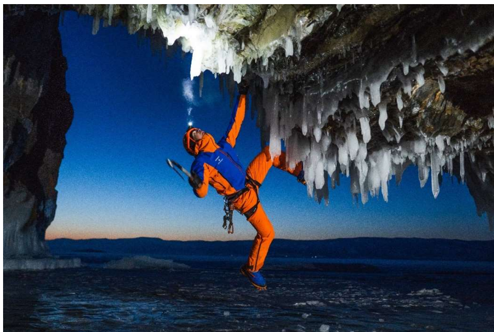
トップアスリートと共に共同開発される「アイガー・エクストリーム」