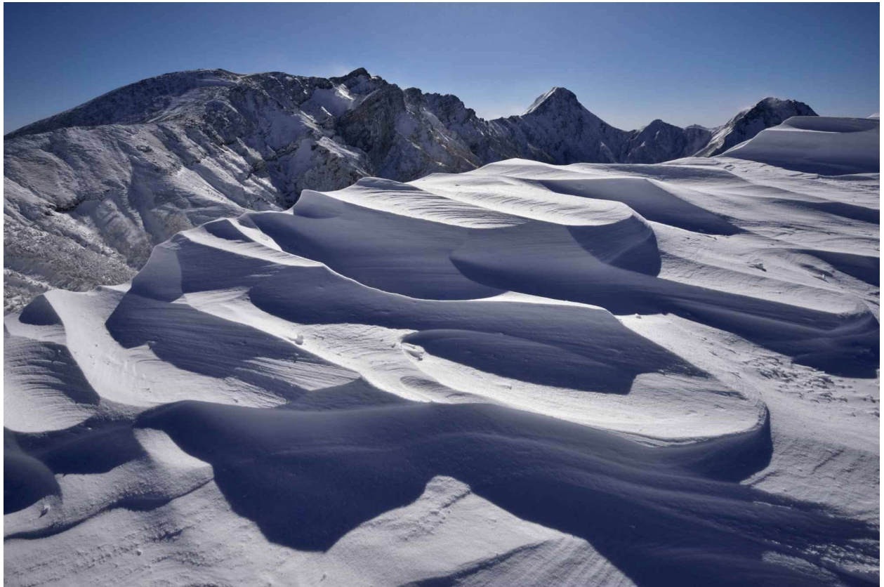
シュカブラと厳冬の南八ヶ岳連峰