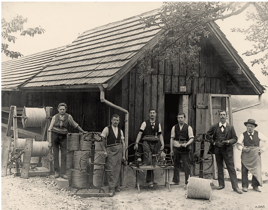
スイス・ディンティコンでロープメーカーとして創業。マムートはドイツ語でマンモスという意味

マムートは、1862年スイス・ディンティコンでロープメーカーとして誕生しました。農業用のロープとしてスタートし、時代の流れと共に登山用ロープとして使われるようになりました。1964年には国際登山組織 UIAA の認定を初めて受けたシングルロープを開発し、ロープブランドとしてのポジションを確立。その後、1984年にはアパレル・カラビナ・ハーネスを含む総合的なコレクションを発表し、ハードウェアブランドから総合マウンテンブランドへと発展していきます。その後、1995年に発表された「エクストリームコレクション」は、トップアスリートと共同開発されたマムートの最高峰モデルです。最先端の素材と高い技術力で機能性・品質を妥協なく追い求め、革新的な製品を多く作り出し、名誉ある賞を受賞するまでになりました。2022年現在でも、このエクストリームコレクションは、「アイガー・エクストリーム」(Eiger Extreme)と名前を変え、マムートのフラッグシップコレクションとしてトップアスリートと共に作り続けることで、多くのお客様に革新的な製品を提案し続けています。マムートは160年の間に培ったイノベーションの遺伝子をもとに、今後も多くのイノベーションを生み出していきます。