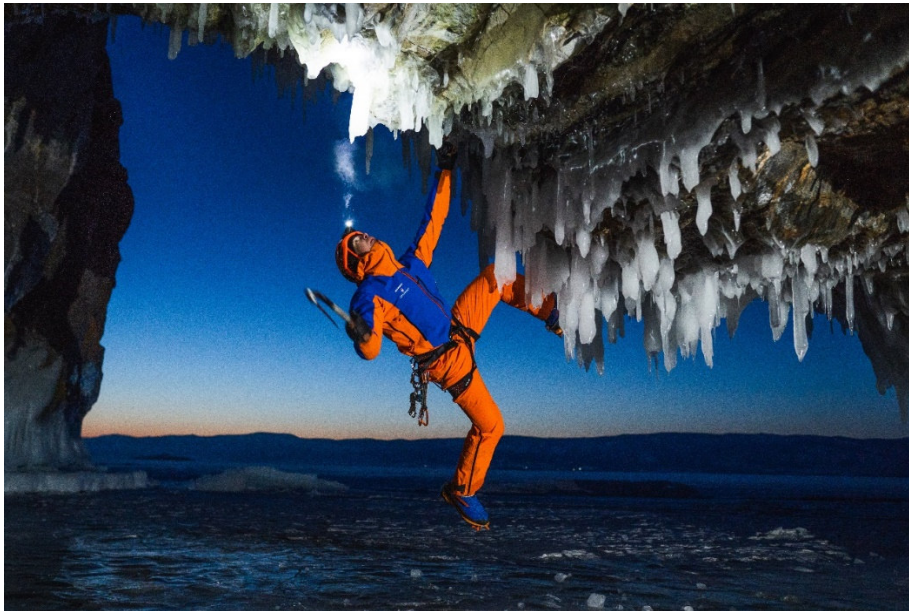
トップアスリートと共に共同開発される「アイガー・エクストリーム」