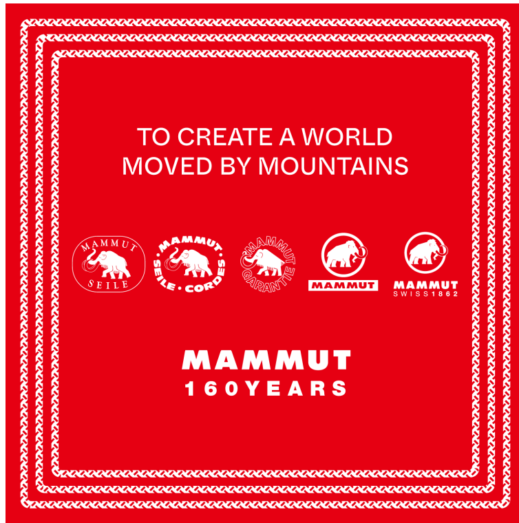
5つの歴代ロゴをプリントしたオリジナルバンダナ