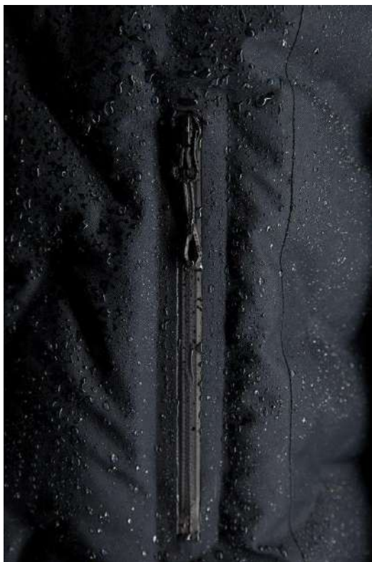
山岳シーンでも使用される止水ファスナー