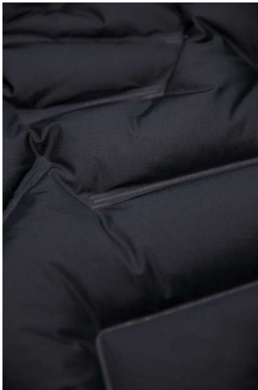
レーザーフェーズテクノロジーによりはがれのリスクなどもなく長く使用できる