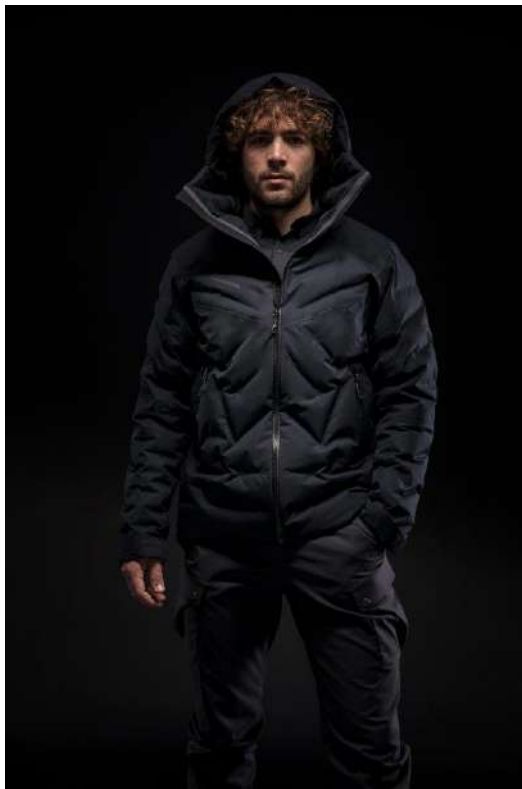
Photics HS Thermo Hooded Jacket Men ¥108,900 https://www.mammut.jp/items/1010-27691