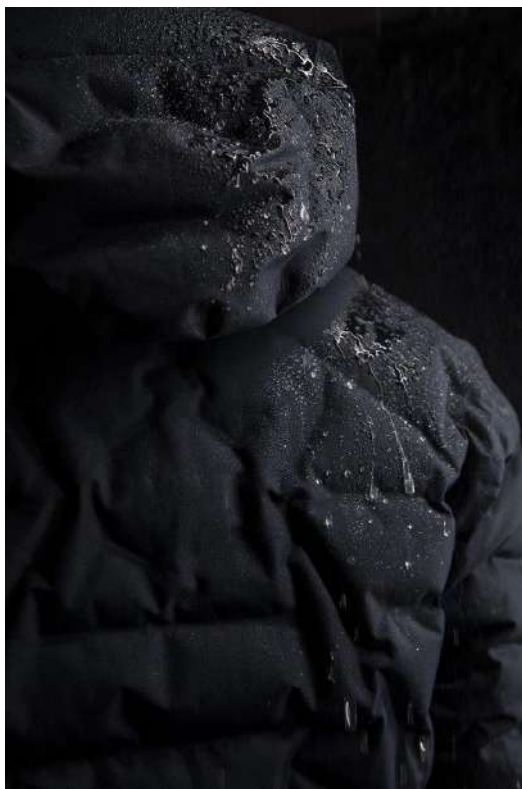
マムート独自防水透湿性素材「ドライテクノロジー」は完全防水・防風でムレも軽減。

その他、今シーズンからの新作「Floeberg HS Thermo Hooded Coat（フローバーグ エイチエス フーデッド コート）」や「Icyglow IN Hooded JK（アイシーグロー イン フーデッド ジャケット）」などのダウンジャケットを中心としたこれからの時期にぴったりのマムートのアーバンコレクションを展開致します。