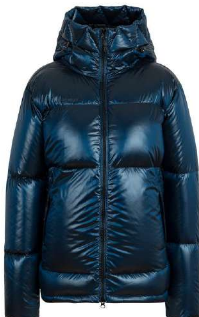
Icyglow IN Hooded Jacket / ¥52,800 https://www.mammut.jp/items/1013-02260