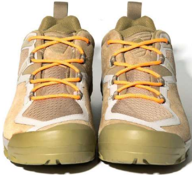
国内初別注シューズ「hobo × MAMMUT」サブエンロー GTX : ¥20,350