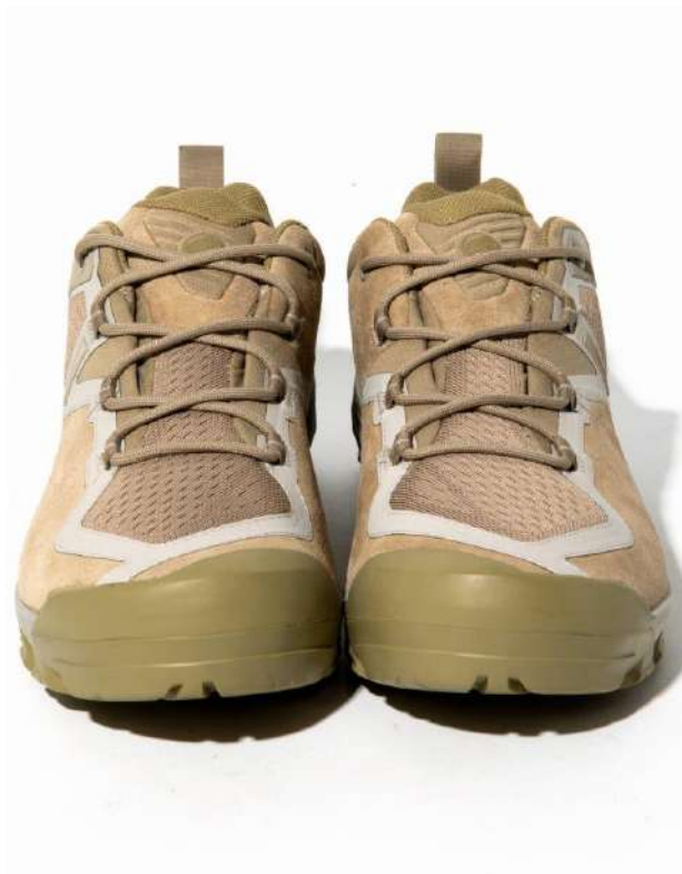
国内初別注シューズ「hobo × MAMMUT」サブエンロー GTX : ¥20,350