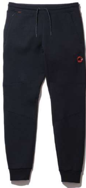
Dyno ML Hooded Jacket AF Men Classic/¥15,400 (税込) 上下セットアップのテクニカルフリース。ジム使いやボルダリングにも人気の一着。