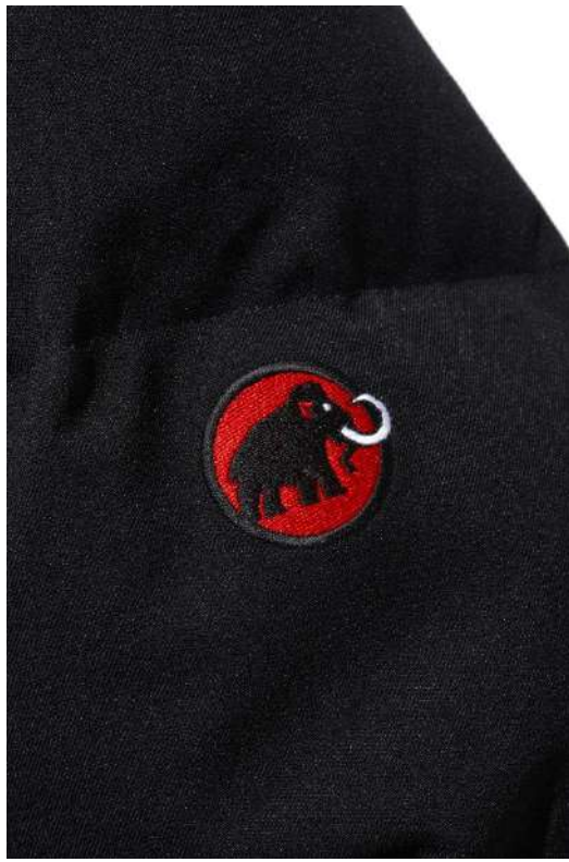
右胸と左袖には往年の旧ロゴが刺繍されている。