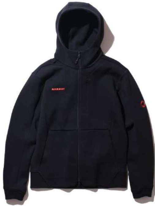
Dyno ML Hooded Jacket AF Men Classic/¥15,400 (税込) 上下セットアップのテクニカルフリース。ジム使いやボルダリングにも人気の一着。