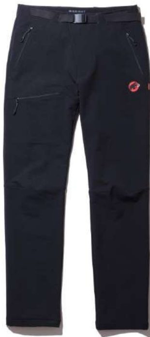
Yadkin SO Pants AF Men Classic/¥18,700 (税込) 厚手のトレッキングパンツ。裏面が微起毛しており肌あたりもよく暖かい。