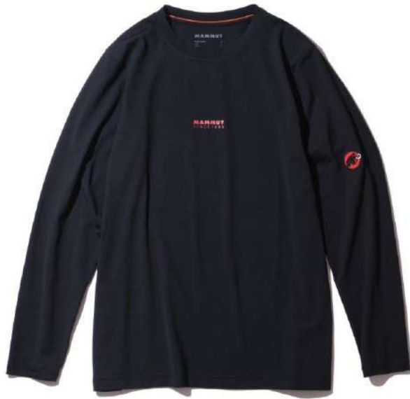
QD Logo Print Longsleeve T-Shirts AF Men Classic/¥8,140 (税込) 速乾ロングスリーブTシャツ。ハイキングや普段使いにも。