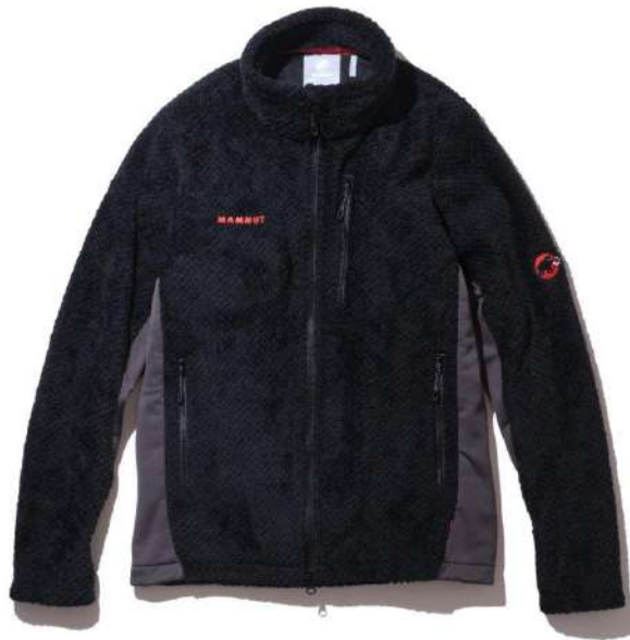
Goblin Advanced ML Jacket Men Classic / ¥28,600 (税込) 脇口にストレッチフリース組み合わせたハイロフトフリース。