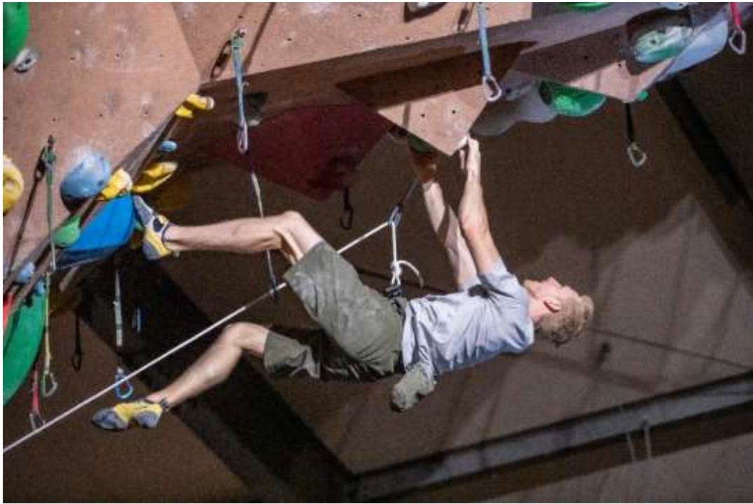
Jakob Schubert ヤコブ・シューベルト