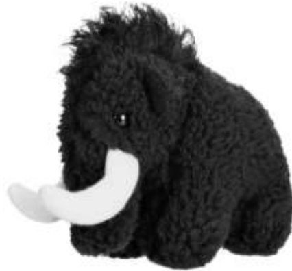
非売品の大人気なマンモスのぬいぐるみ

5/20(木)～6月30日(水)迄、マムートジャパン公式インスタグラムでインスタグラムキャンペーンを開催いたします。マムートジャパンの公式インスタグラムをフォロー、様々なピークを目指すご自身の写真を投稿していただき、#reachyourpeak をタグ付けてくださった方の中から抽選で20名の方に、マムートトイをプレゼントします。