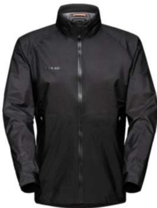
【Lightweight HS Hooded Jacket AF Men】